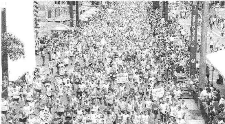
Milhares de corredores vão apenas para participar da festa, realizada em São Paulo, todo dia 31, na tradicional Corrida de São Silvestre

Em sua 95ª edição, a tradicional prova de São Paulo conta com milhares de corredores, que largam no pelotão geral, que participam apenas por diversão