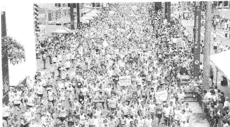
Milhares de corredores vão apenas para participar da festa, realizada em São Paulo, todo dia 31, na tradicional Corrida de São Silvestre

Em sua 95ª edição, a tradicional prova de São Paulo conta com milhares de corredores, que largam no pelotão geral, que participam apenas por diversão